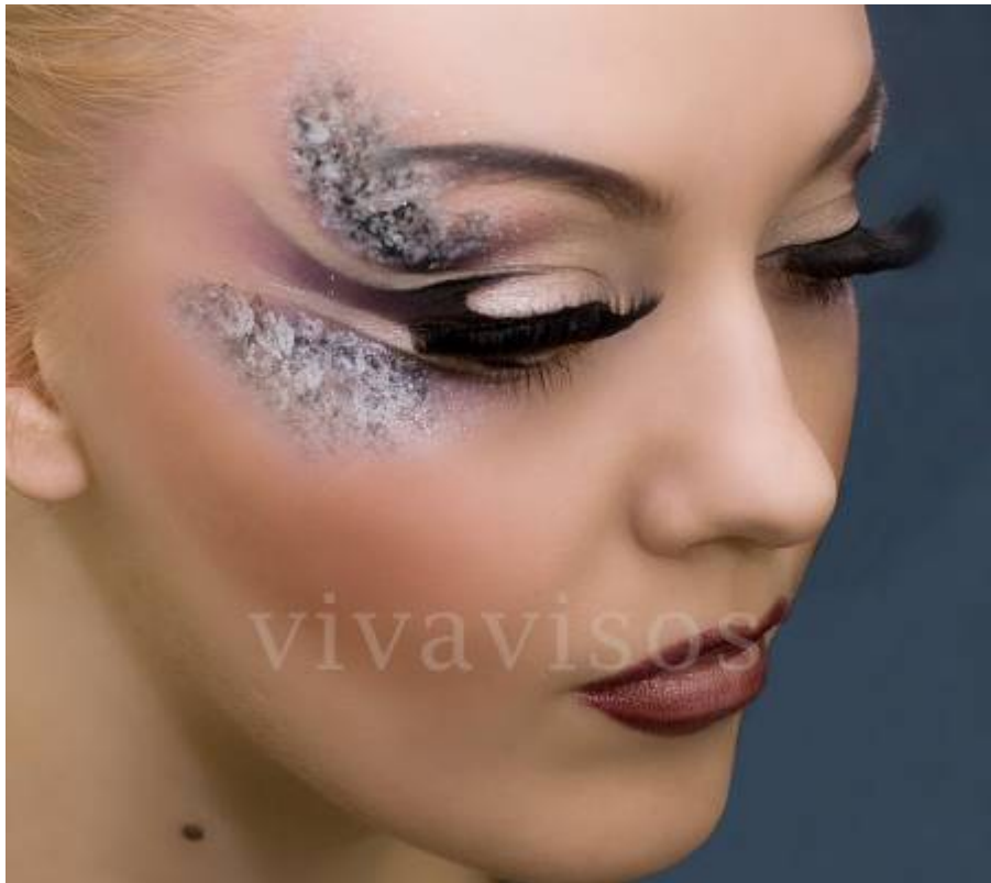
Diseño de la fantasía